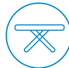
Tafel waar u veilig op kunt snijden